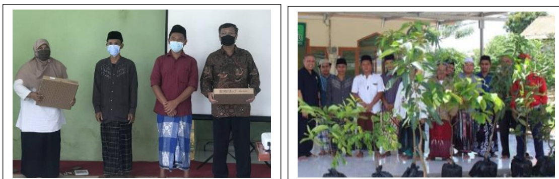
Gambar 4. Dokumentasi kegiatan

Para peserta dilatih untuk membuka masing-masing handphone mereka masing-masing dan menginstal aplikasi secara bersama-sama [10]. Mulai dari pendaftaran akun sampai dengan cara penggunaan aplikasi. Tidak sedikit para peserta yang bertanya mengenai penggunaan aplikasi tersebut. Narasumber menjelaskan step by step langkah-langkah penggunaan aplikasi sehingga peserta dapat mengikuti langkah-langkahnya dengan benar [11].