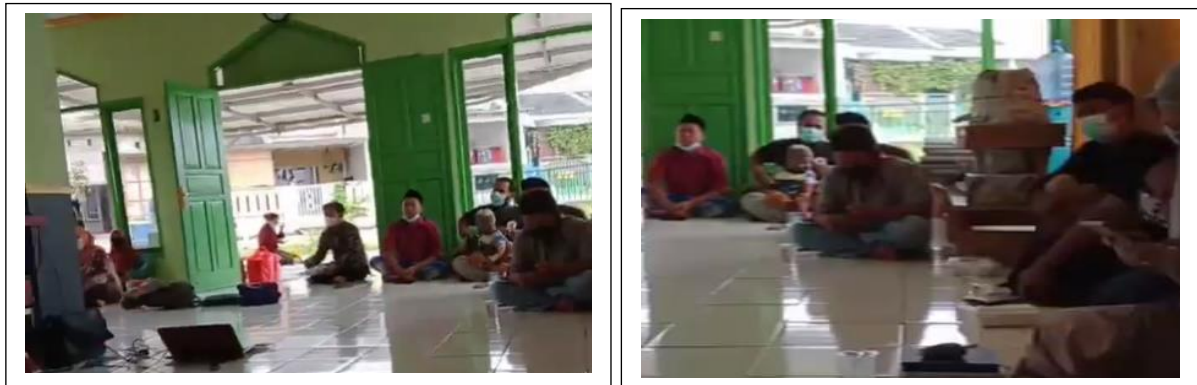
Gambar 3. Dokumen kegiatan PKM

Narasumber ke tiga menjelaskan bahwa pemisahan antara uang pribadi dengan usaha menjadi dasar dalam menjalankan usaha. Tidak sedikit UMKM mencampur uang usaha dengan uang pribadi yang pada akhirnya tidak terkontrolnya pendapatan hasil usaha. Narasumber kedua menyarankan agar para pelaku usaha memiliki dua jenis buku kecil dimana satu untuk pemasukan dan satu untuk pengeluaran. Kedua buku tersebut dibedakan agar mempermudah pengontrolan pemasukan dan pengeluaran. Pencatatan setiap transaksi harus dilakukan mulai hari ini supaya semua yang berhubungan dengan usaha tercatat dalam dua buku tersebut. Selain itu narasumber kedua juga memaparkan bagaimana cara pencatatan dan menghitung harga pokok, biaya operasional, biaya bahan baku dan bagaimana menyusun laporan keuangan sederhana.