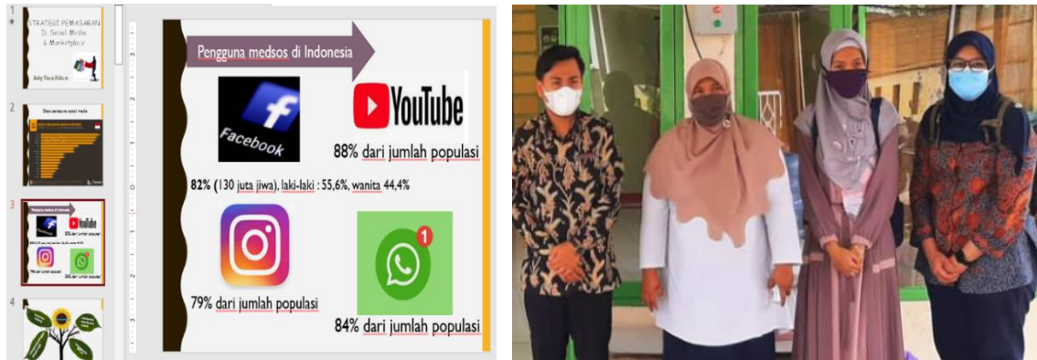
Gambar 2 Dokumentasi kegiatan

Narasumber ke tiga menjelaskan bahwa pemisahan antara uang pribadi dengan usaha menjadi dasar dalam menjalankan usaha. Tidak sedikit UMKM mencampur uang usaha dengan uang pribadi yang pada akhirnya tidak terkontrolnya pendapatan hasil usaha. Narasumber kedua menyarankan agar para pelaku usaha memiliki dua jenis buku kecil dimana satu untuk pemasukan dan satu untuk pengeluaran. Kedua buku tersebut dibedakan agar mempermudah pengontrolan pemasukan dan pengeluaran. Pencatatan setiap transaksi harus dilakukan mulai hari ini supaya semua yang berhubungan dengan usaha tercatat dalam dua buku tersebut. Selain itu narasumber kedua juga memaparkan bagaimana cara pencatatan dan menghitung harga pokok, biaya operasional, biaya bahan baku dan bagaimana menyusun laporan keuangan sederhana.