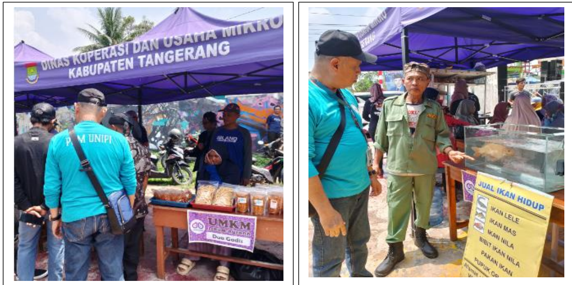
Gambar 2. Dokumentasi kegiatan bazar

Berbagai produk di jual dalam kegiatan bazar mulai dari produk olahan ikan, produk makanan, produk kerajinan (kreatif), furniture, dan produk yang dihasilkan oleh koperasi dan KWT Drum Bujana. Kegiatan bazar disambut baik oleh masyarakat kampung tematik Drum Bujana dan rencana kegiatan serupa akan terus dilakukan secara rutin untuk membudayakan pembelian produk lokal Drum Bujana. Tidak sedikit masyarakat luar Drum Bujana yang datang dan membeli produk-produk yang dijajakan dalam bazar. Masyarakat tumpah ruah berbondong-bondong untuk memeriahkan acara sekaligus membeli produk-produk UMKM Drum Bujana.