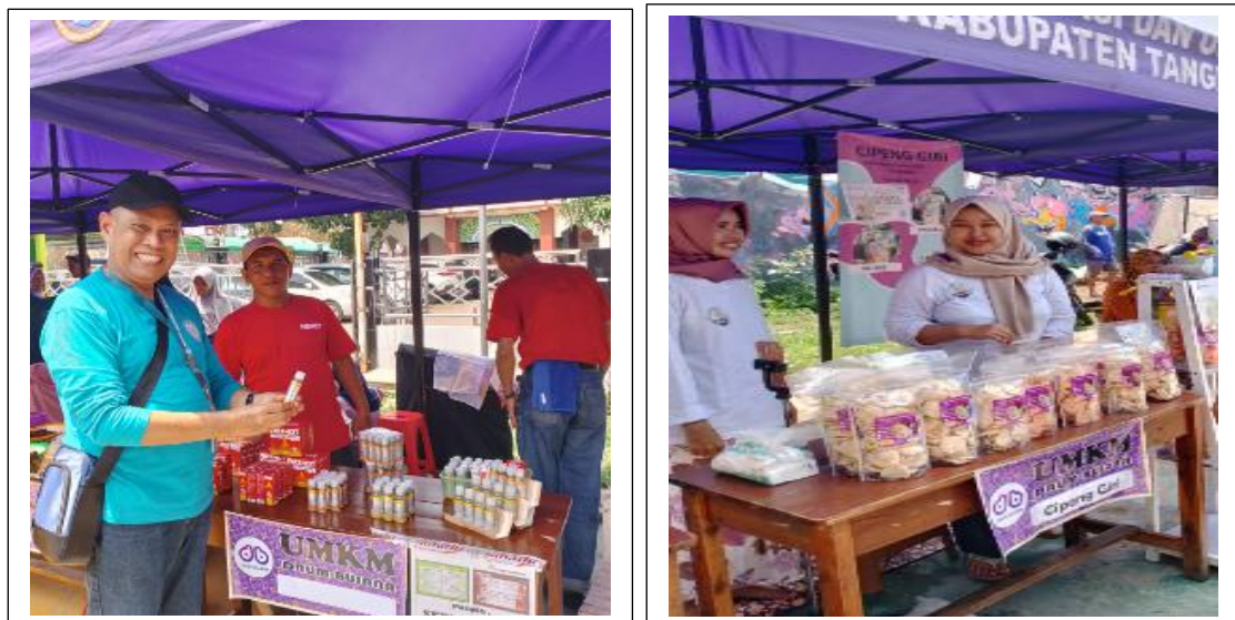
Gambar 3. Dokumen kegiatan Bazar

Beberapa pengunjung memadati lokasi bazar dan yang paling diminati oleh pengunjung adalah produk-produk kuliner seperti makana ringan (kue/roti, cemilan), nasi bakar, dan kerajinan tangan yang dihasilkan oleh pelaku UMKM Drum Bujana. Tidak sedikit masyarakat yang berkunjung dan memesan produk furniture berbahan dasar drum bekas seperti tempat sampah, meja, kursi, sound sistem, hiasan lampu, jam dinding, kitchen set dan lainnya. Pemesanan tidak hanya melayani lokal tetapi juga sudah merambah ke kota-kota lainnya dengan pengiriman melalui jasa ekspedisi atau lainnya.