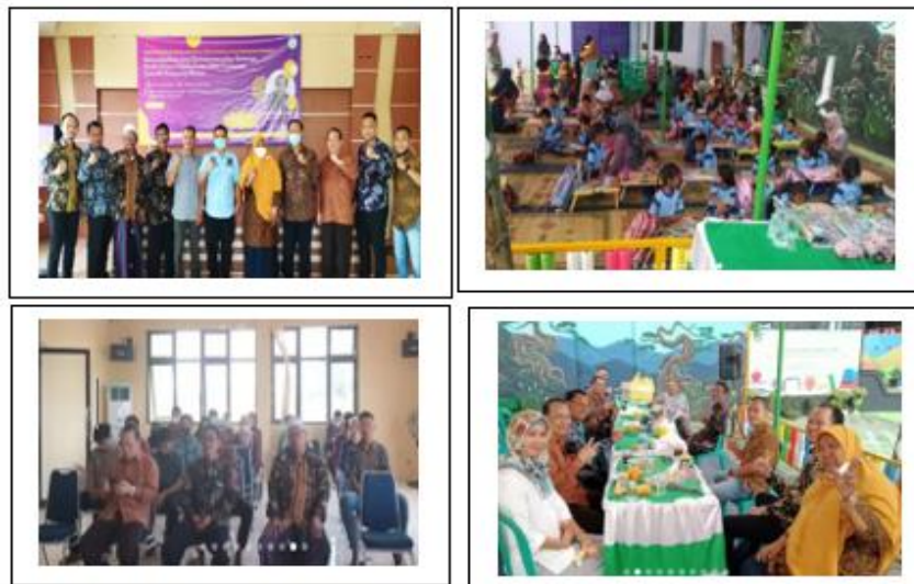
Gambar 6. Kegiatan di kampung Bonsai

Dosen dan mahasiswa PKM di kampung tematik Bonsai memiliki beberapa kegiatan yang bermanfaat bagi masyarakat di kampung tematik Bonsai diantaranya membuka taman baca untuk anak-anak, pelatihan entrepreneur bagi masyarakat dan para karang taruna, serta lomba menggambar dan mewarnai untuk anak-anak [20].