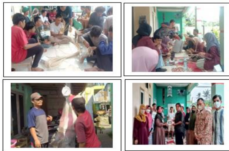
Gambar 4. Kegiatan di Kampung Hijau

Kegiatan yang dilakukan di kampung tematik kampung Hijau melalui pelatihan kerajinan tangan anyaman berbahan rotan, kegiatan bank sampah untuk lingkungan yang bersih dan menyadarkan masyarakat akan pentingnya kebersihan dan membuat sampah menjadi barang ekonomis dan bernilai jual. Pelatihan diikuti oleh masyarakat kampung tematik, karang taruna, mahasiswa dan dosen. Kegiatan ini bertujuan untuk melatih Masyarakat kampung tematik memiliki jiwa entrepreneurship dan mampu memanfaatkan sumber daya lokal daerah menjadi produk yang dapat menghasilkan nilai tambah