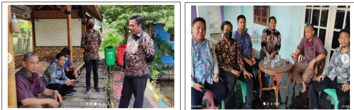
Gambar 9 Kegiatan di kampung Tempe