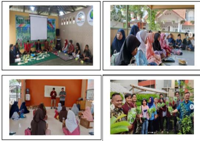
Gambar 5. Kegiatan di kampung Tahfid

Dosen dan mahasiswa PKM di kampung tematik Bonsai memiliki beberapa kegiatan yang bermanfaat bagi masyarakat di kampung tematik Bonsai diantaranya membuka taman baca untuk anak-anak, pelatihan entrepreneur bagi masyarakat dan para karang taruna, serta lomba menggambar dan mewarnai untuk anak-anak [20].