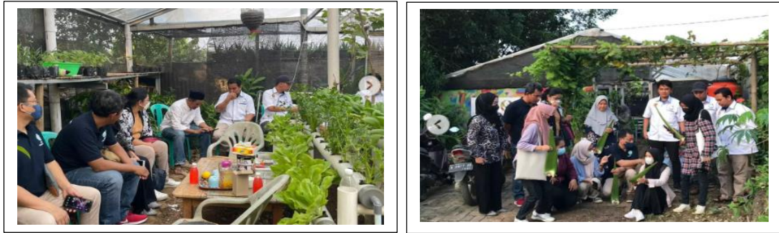
Gambar 10 Kegiatan di kampung Toga

Meskipun kegiatan sudah berakhir di Desember 2022 (dimana awalnya akan berakhir di September 2022) namun karena kegiatan belum tuntas maka kegiatan diperpanjang sampai dengan bulan Desember 2022. Ke depannya kegiatan PKM akan terus dilanjutkan dengan agenda kegiatan yang lebih menarik.