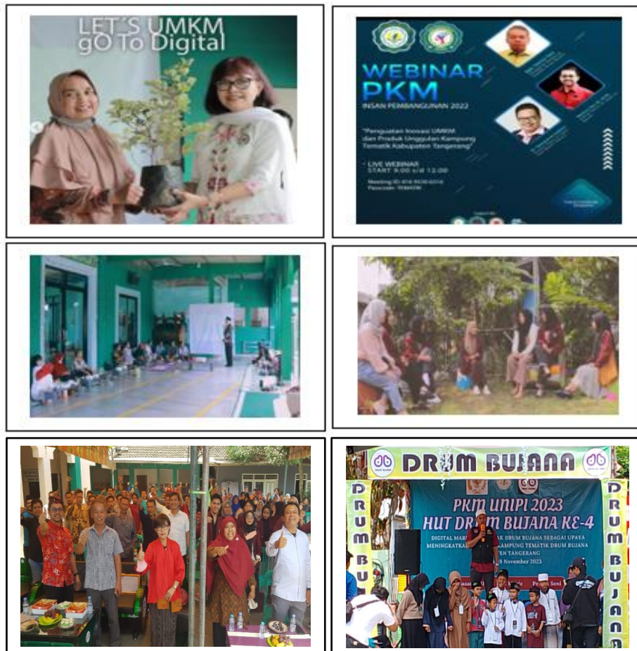
Gambar 2. Penutupan PKM di Kampung Tematik Drum Bujana [19]

Setelah profil kampung tematik dilanjutkan dengan workshop penguatan inovasi dan produk unggulan kampung tematik, pelatihan digital marketing, pelatihan pembuatan laporan keuangan sederhana, pembuatan logo untuk para pelaku UMKM, penanaman pohon untuk KWT kampung tematik, dan penutupan PKM bersama anggota komisi XI DPR RI [19].