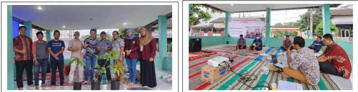
Gambar 8 Kegiatan di kampung Indah Kreasi

Untuk kegiatan yang ada di kampung tematik Indah Kreasi, Maen Air, Indah Kreasi, Tempe, Toga dan lainnya dilakukan kunjungan awal sebagai pengenalan dan silaturahmi untuk mengetahui kondisi real di kampung tematik. Dilanjutkan dengan kegiatan pembinaan, sosialisasi dan pendampingan dalam bidang ekonomi dan lingkungan. Pelatihan melibatkan dosen dan mahasiswa sesuai dengan kebutuhan dan kemampuan masing-masing team.