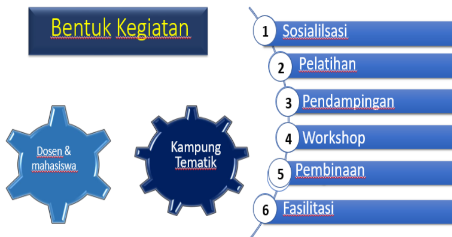
Gambar 1. Jenis Kegiatan PKM

Dosen dan mahasiswa terjun langsung ke kampung tematik diawali dengan kunjungan pertama dengan agenda pemetaan potensi dan permasalahan kampung tematik. Metode yang dilakukan dalam kegiatan PKM ini antara lain berupa sosialisasi, pelatihan, pendampingan, workshop, pembinaan, dan fasilitasi terlihat pada gambar 1.