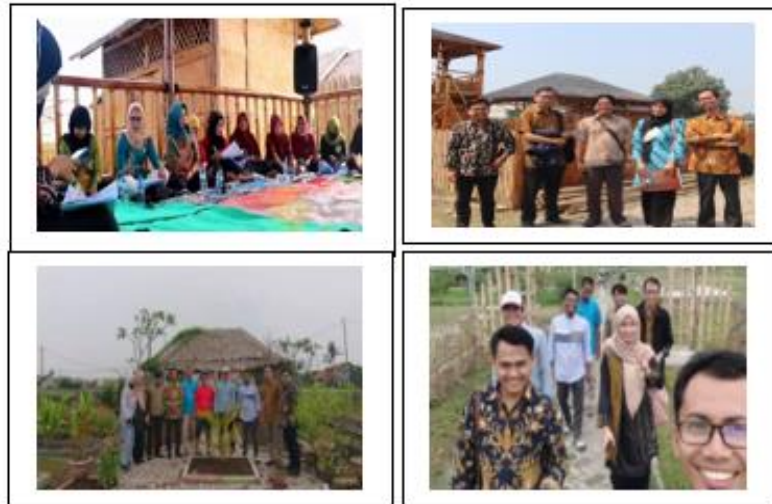
Gambar 3. Kegiatan di Kampung Waru Brilliant

Kegiatan yang dilakukan di kampung tematik kampung Hijau melalui pelatihan kerajinan tangan anyaman berbahan rotan, kegiatan bank sampah untuk lingkungan yang bersih dan menyadarkan masyarakat akan pentingnya kebersihan dan membuat sampah menjadi barang ekonomis dan bernilai jual. Pelatihan diikuti oleh masyarakat kampung tematik, karang taruna, mahasiswa dan dosen. Kegiatan ini bertujuan untuk melatih Masyarakat kampung tematik memiliki jiwa entrepreneurship dan mampu memanfaatkan sumber daya lokal daerah menjadi produk yang dapat menghasilkan nilai tambah