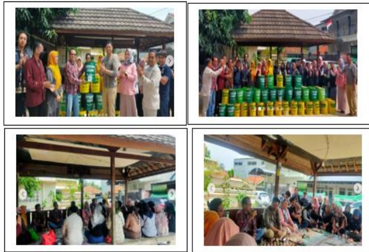
Gambar 7 Kegiatan di kampung Produktif

Untuk kegiatan yang ada di kampung tematik Indah Kreasi, Maen Air, Indah Kreasi, Tempe, Toga dan lainnya dilakukan kunjungan awal sebagai pengenalan dan silaturahmi untuk mengetahui kondisi real di kampung tematik. Dilanjutkan dengan kegiatan pembinaan, sosialisasi dan pendampingan dalam bidang ekonomi dan lingkungan. Pelatihan melibatkan dosen dan mahasiswa sesuai dengan kebutuhan dan kemampuan masing-masing team.