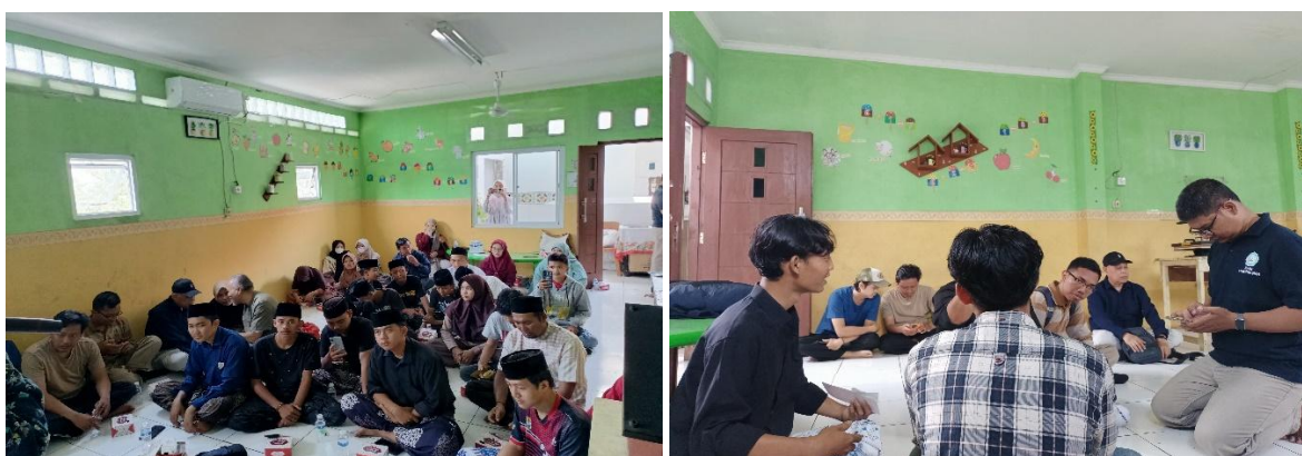
Gambar 2 Dokumentasi Kegiatan

Peserta pelatihan terdiri dari ketua RT sebanyak 1 orang (2%), ketua LLPM sebanyak 1 orang (2%), Dosen sebanyak 10 orang (21%), mahasiswa sebanyak 4 orang (9%), remaja kampung Kadu sebanyak 27 orang (57%) dan dari Faida cendekia sebanyak 4 orang (9%). Remaja Kampung Kadu rata-rata adalah anak putus sekolah, anak yatim piatu yang berada di salah satu pondok pesantren yang ada di Kampung Kadu. Peserta berjumlah 47 orang dengan mayoritas berasal dari remaja kampung Kadu yaitu sebesar 57%. Peserta dengan tertib mengikuti jalannya kegiatan mulai dari registrasi sampai dengan pelatihan berakhir.