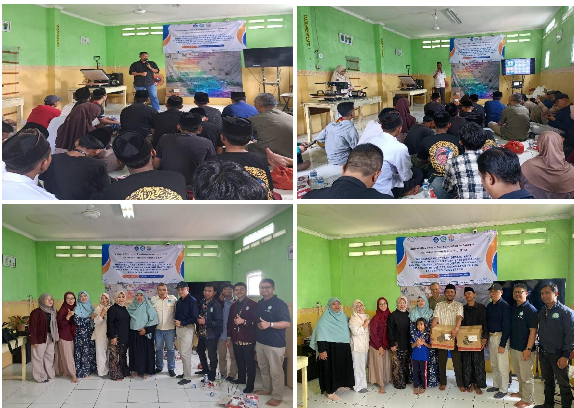
Gambar 3 Dokumentasi Kegiatan Pelatihan

sambutan dilanjutkan dengan materi pelatihan dimana narasumber menyampaikan materi sambil praktek langsung dengan menggunakan media smartphone bagaimana membuat desain dengan menggunakan aplikasi canva. Tim mahasiswa membantu memandu peserta dalam menggunakan aplikasi. Narasumber menyampaikan bahwa aplikasi canva menjadi salah satu aplikasi untuk membuat desain namun masih banyak aplikasi lain yang dapat digunakan dalam membuat desain termasuk menggunakan office ataupun menggunakan teknologi AI. Berbagai aplikasi dapat digunakan dengan mudah dengan belajar dan mencoba. Narasumber juga menyampaikan untuk peserta harus sering-sering belajar, mencoba dan membaca. Untuk pemula agar dapat membuat desain dengan cepat dan mudah maka canva menjadi pilihan terbaik. Pengembangan lebih lanjut bisa menggunakan desain grafis profesional (vector/logo) dengan adobe illustrator (standar industri) atau affinity designer dengan harga yang terjangkau. Editing foto profesional yaitu adobe photoshop atau affinity photo. Ilustrasi digital di iPad dengan procreate menjadi salah satu aplikasi yang memiliki hasil lebih baik. desain UI/UC dan prototyping dengan figma juga menjadi alternative yang cukup menarik. Desain 3D dengan blender yang saat ini belum ada saingannya sedangkan untuk presentasi kolaboratif dapat menggunakan google slides atau canva.