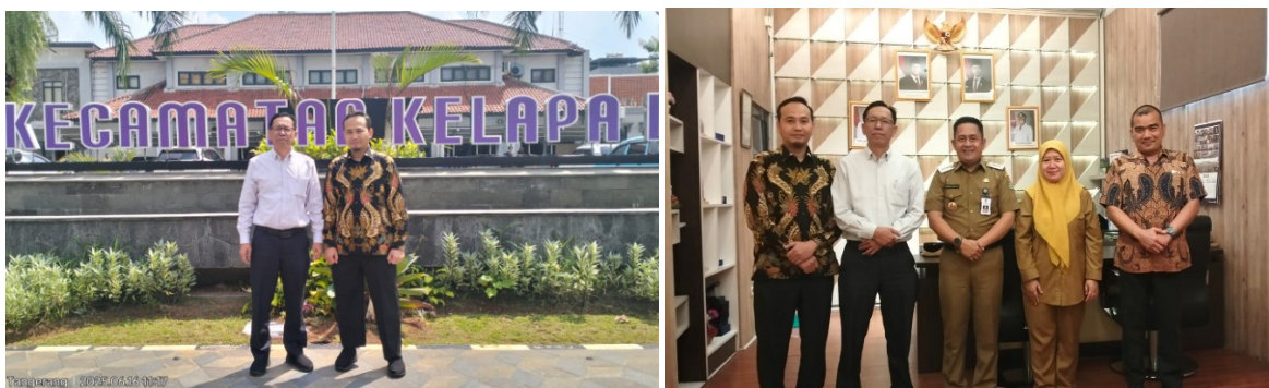
Gambar 3 Dokumentasi Kegiatan

Dialog interaktif telah diselesaikan dengan baik dan lancar dengan suasana yang santai dan humoris namun tetap serius. Untuk selanjutnya berdasarkan hasil dialog atau diskusi akan dibuat pelaporan akhir yang akan diserahkan ke Bappeda sebagai bentuk pertanggungjawaban kegiatan. Tahapan rekomendasi sistem selanjutnya memerlukan penyamaan persepsi dan kesepakatan antara Kecamatan, Dinas Dukcapil, dan Bappeda sebagai dasar koordinasi dalam peningkatan pelayanan publik. Di akhir dialog tim dosen menyampaikan kembali garis besar kebutuhan yang ada di kecamatan untuk memastikan agar kebutuhan tersebut sudah sesuai. Dialog diakhiri dengan ramah tamah tim dosen dengan camat Kelapa Dua sebelum tim pamit untuk mengakhiri kegiatan dialog.