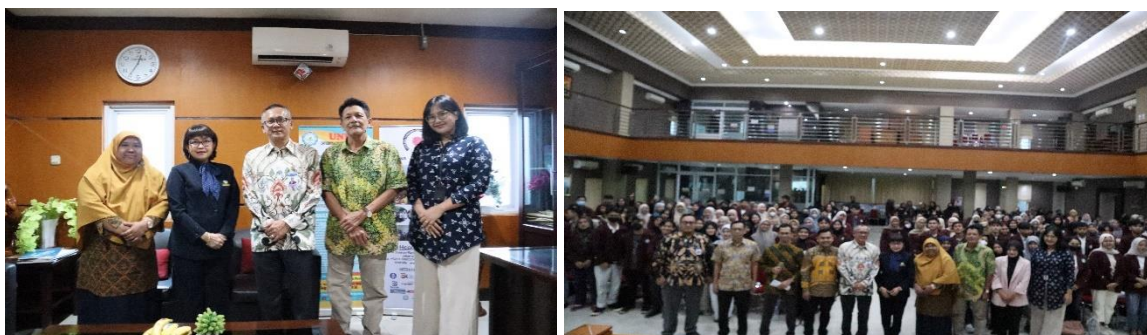
Gambar 4 Dokumentasi Kegiatan Sosialisasi dan Edukasi

Berdasarkan gambar di atas dapat dijelaskan bahwa instrument dan anal pembayaran yang telah digunakan oleh masyarakat di Indonesia seperti gopay, shopee pay, OVO, DANA dan Link Aja. Sedangkan untuk transaksi jual beli melalui platform e-commerce masyarakat Indonesia telah menggunakan tokopedia, Shopee, Lazada, Bukalapak dan blibli.com. Narasumber juga menjelaskan mengenai pentingnya investasi dan pemilihan investasi yang tepat dan legal menjadi hal yang sangat penting. Berbagai bentuk/jenis investasi yang Indonesia antara lain bareksa, stoxkbit, ajaib, tanamduwit, bibit dan pluang. Keenam jenis investari tersebut telah terdaftar secara resmi dan legal.