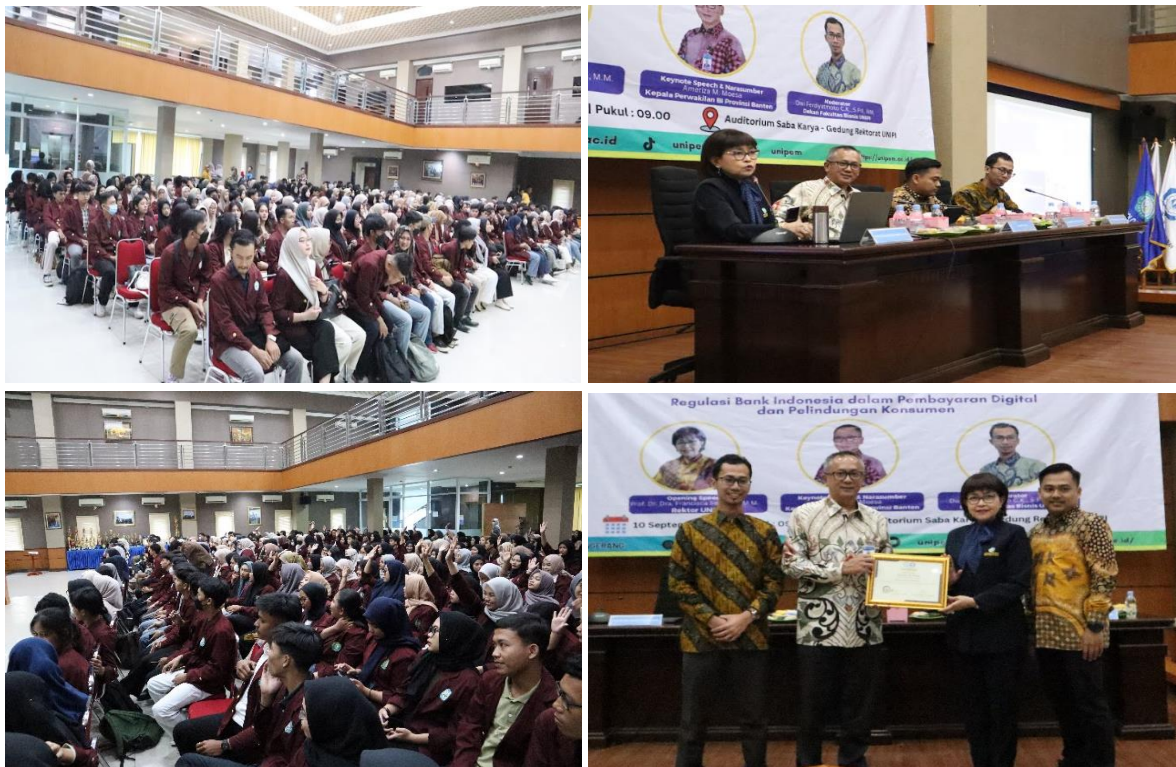
Gambar 2. Dokumentasi Kegiatan Sosialisasi dan Edukasi

Acara dibuka oleh MC sekaligus moderator dan dilanjutkan dengan menyanyikan lagu kebangsaan Indonesia Raya. Setelah menyanyikan lagu kebangsaan dilanjutkan dengan opening speech yang secara langsung disampaikan oleh rektor Universitas Insan Pembangunan Indonesia (UNUPI). Dimana disampaikan beberapa point mengenai pembayaran digital yang saat ini tidak bisa dihindari lagi. Kemudahan dan kecepatan transaksi menjadi salah satu tujuan dalam penggunaan pembayaran digital. Rektor Unipi juga menyampaikan agar peserta terus mensosialisasikan kepada masyarakat sekitar untuk menghindari pinjaman online dan judi online yang sekarang ini marak di berbagai kalangan. Tidak hanya kalangan dewasa tetapi judi online juga sudah merambah di dunia anak-anak. Sosialisasi ini bukan menjadi tugas pemerintah saja tetapi sebagai warga negara yang baik dan taat azas maka diharapkan untuk terus berkontribusi dalam pembangunan karakter sumber daya manusia di Indonesia. Salah satu bentuk kontribusi nyata dalam mengedukasi dan mensosialisasikan kepada saudara, kerabat dan tetangga terdekat.