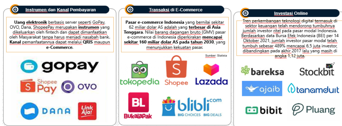
Gambar 3. Ekonomi keuangan digital, inovasi dan implementasi

Berdasarkan gambar di atas dapat dijelaskan bahwa instrument dan anal pembayaran yang telah digunakan oleh masyarakat di Indonesia seperti gopay, shopee pay, OVO, DANA dan Link Aja. Sedangkan untuk transaksi jual beli melalui platform e-commerce masyarakat Indonesia telah menggunakan tokopedia, Shopee, Lazada, Bukalapak dan blibli.com. Narasumber juga menjelaskan mengenai pentingnya investasi dan pemilihan investasi yang tepat dan legal menjadi hal yang sangat penting. Berbagai bentuk/jenis investasi yang Indonesia antara lain bareksa, stoxkbit, ajaib, tanamduwit, bibit dan pluang. Keenam jenis investari tersebut telah terdaftar secara resmi dan legal.