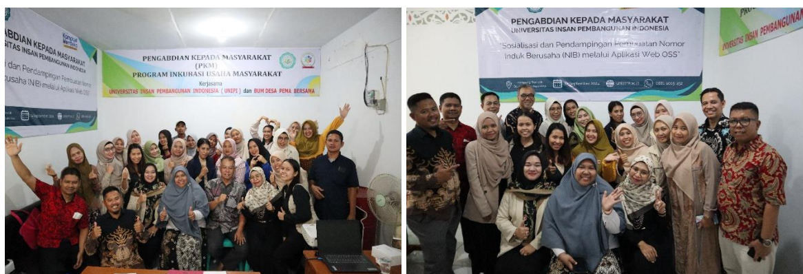
Gambar 3 Dokumentasi kegiatan Sosialisasi dan Pendampingan

Setelah narasumber pertama selesai menyampaikan paparannya mengenai pengertian, fungsi, manfaat, dan persyaratan pembuatan NIB maka dilanjutkan langsung dipandu oleh narasumber kedua yaitu peserta praktek langsung dan sesuai dengan dokumen yang telah disiapkan sebelumnya telah diinfo oleh tim bahwa peserta harus membawa KTP dan NPWP jika memang dibutuhkan boleh membawa Kartu Keluarga. Persyaratan lain seperti keanggotaan BPJS kesehatan dan ketenagakerjaan merupakan persyaratan opsional yang di bawa oleh peserta. Narasumber kedua menuntun dan membimbing peserta untuk membuat NIB step by step sesuai dengan data usaha yang dimiliki. Masing-masing peserta didampingi satu sampai dua dosen dengan laptop yang sudah disiapkan oleh tim.