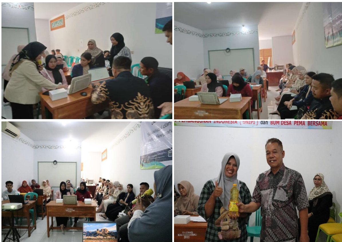
Gambar 2. Dokumentasi Kegiatan PkM

Kegiatan dibuka langsung oleh wakil rektor 1 bidang akademik Universitas Insan Pembangunan dimana beliau menyampaikan bahwa kegiatan di Desa Pete sudah yang ke sekian kali dan kolaborasi antara kampus dengan Bum Desa Pema Bersama sudah berlangsung sejak tahun 2020 yang waktu itu diawali dengan kegiatan pembuatan profil kampung tematik Drum Bujana diikuti dengan kegiatan workshop produk unggulan UMKM [17] dan mengundang Komisi XI DPR RI untuk meningkatkan ekonomi masyarakat melalui kearifan lokal masyarakat [18]. Disampaikan pula bahwa kampus telah bekerja sama dalam program inkubasi dengan penandatanganan PKS di aula desa Pete pada hari Sabtu, 31 Agustus 2024 yang lalu. Kampus akan selalu komitmen untuk mendampingi kegiatan inkubasi ini hingga selesai sampai bulan Desember 2024. Tidak kalah penting kegiatan ini akan menciptakan inovasi dan entrepreneur yang unggul dan berdaya saing minimal secara lokal dan nasional [19].