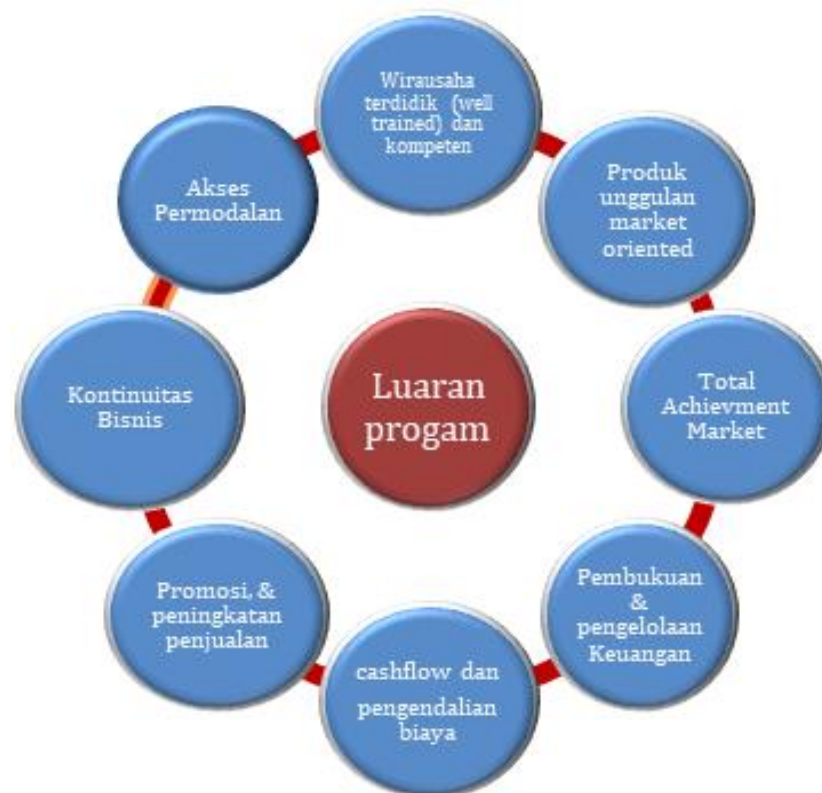
Gambar 2. Luaran program Inkubasi bagi Pelaku UMKM Desa Pete

Kegiatan inkubasi ini memiliki output atau keluaran diantaranya terciptanya wirausaha yang terdidik (well trained) dan kompeten, menghasilkan produk yang unggul dan mampu bersaing, usaha yang memiliki Total Achievement Market yang memungkinkan bisnis bertumbuh, Pembukuan bankable dan pengelolaan keuangan, kemampuan pelaku usaha untuk mengelola cashflow dan pengendalian biaya. Peningkatan volume penjualan dan pengelolaan pelanggan dan terbentuknya bisnis ter sistem dan terorganisasi serta terjalin link untuk akses Permodalan.