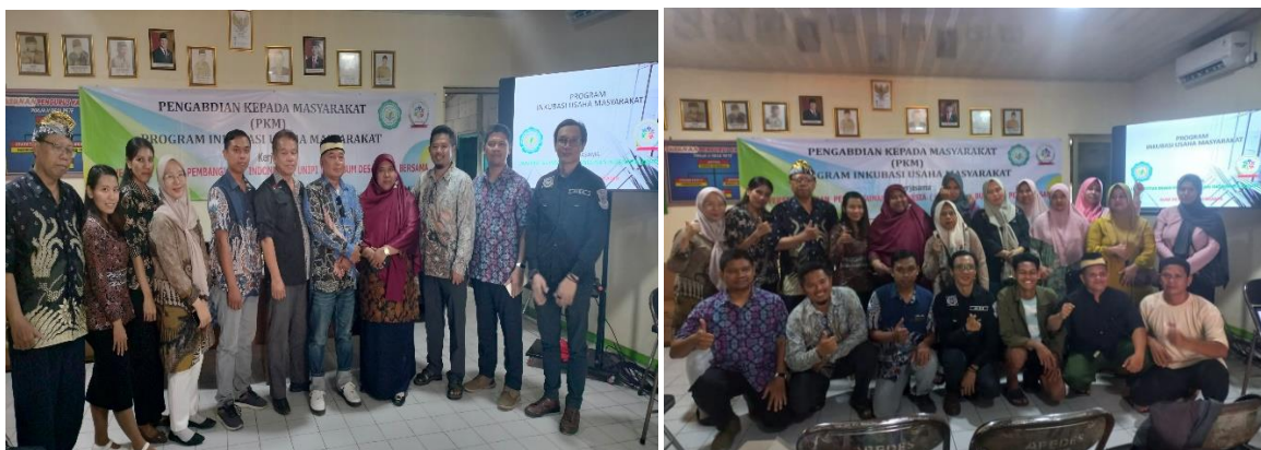
Gambar 3. Dokumentasi Kegiatan Opening Inkubasi

Kegiatan berlangsung dengan baik dan lancar, diakhiri dengan doa penutup yang dipimpin oleh salah satu pengurus masjid di Desa Pete. Setelah doa penutup dilanjutkan dengan monitoring dan evaluasi dimana peserta diberikan beberapa pertanyaan seputar kegiatan, bagi peserta yang bisa menjawab diberikan hadiah berupa doorprice dari panitia. Semua pertanyaan yang disampaikan terjawab dengan baik dan peserta sangat antusias untuk mengikuti kegiatan inkubasi selama 4 bulan ke depan dengan harapan bisa meningkatkan pengetahuan dan ketrampilan untuk mendukung usahanya. Beberapa peserta menyampaikan bahwa kegiatan ini sangat bagus dan mulia sehingga perlu dilakukan tidak hanya di desa Pete Tigaraksa tetapi dilakukan di desa lain agar masyarakat sama-sama maju taraf hidup masyarakatnya. Usulan ditampung terlebih dahulu dan akan ditindak lanjuti oleh tim untuk kegiatan pengabdian kepada masyarakat di semester berikutnya.