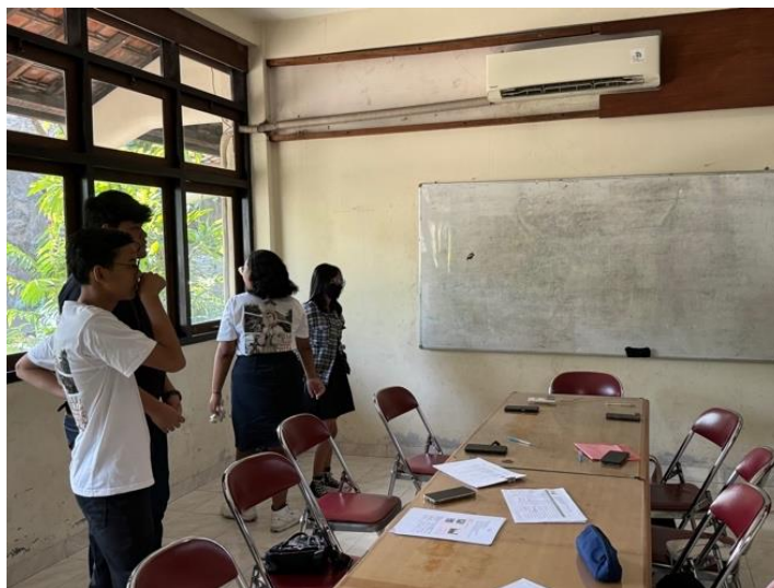
Gambar 2. Peserta Pelatihan Bertanya kepada Teman-Teman yang lain

Gambar 2 merupakan kegiatan di mana peserta mempraktikkan bahasa Inggris dengan menanyai peserta lain. Teknik drilling ini dilakukan untuk mempersiapkan peserta pada kegiatan selanjutnya di mana peserta mempraktikkan bahasa Inggris secara mandiri. Peserta diminta untuk membuat pertanyaan mereka sendiri tentang hal-hal yang ada di sekitar mereka.