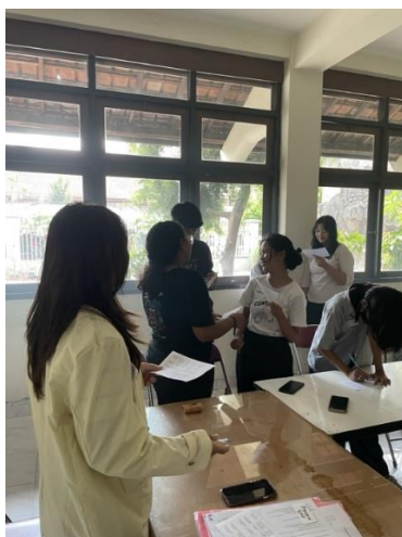
Gambar 1: Peserta Pelatihan Bermain Game Pengantar Materi

Tahap pelaksanaan pelatihan dilaksanakan selama 3 bulan, yaitu November 2023 sampai Januari 2024. Sebanyak 12 peserta yang terdiri atas 9 siswa SMP dan 3 siswa SMA/SMK mengikuti pelatihan wicara yang dilaksanakan di Gedung Karya Sosial Widyamandala Kotabaru. Pada pertemuan pertama, materi yang diberikan terkait dengan topik Talents . Sebelum pemberian materi, tutor memberikan aktivitas pengantar dengan game yang berkaitan dengan topik yang akan dipelajari hari itu. Menurut [11] games tidak hanya sebagai sarana hiburan saja, tetapi juga dapat dimanfaatkan dalam konteks pembelajaran di kelas. Oleh sebab itu, pada pengabdian ini game digunakan sebagai pengantar materi di kelas seperti yang tertera pada Gambar 1.